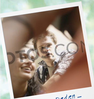
Zeit zum Reden ...